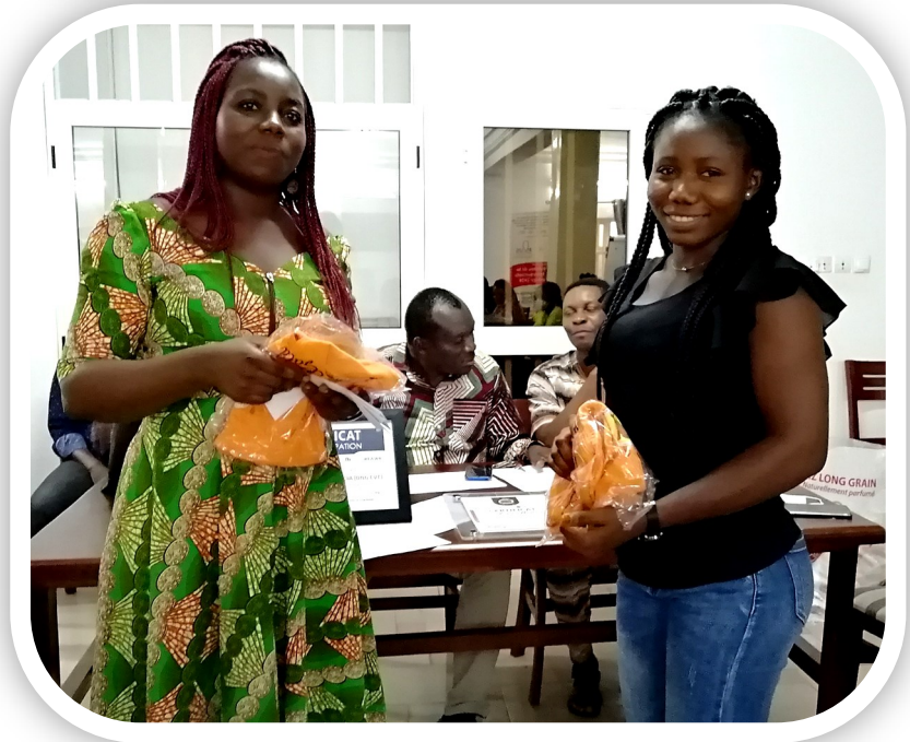
Images prises lors de la remise des primes de performance

C'est également une opportunité de féliciter les meilleurs performances par une prime trimestrielle.