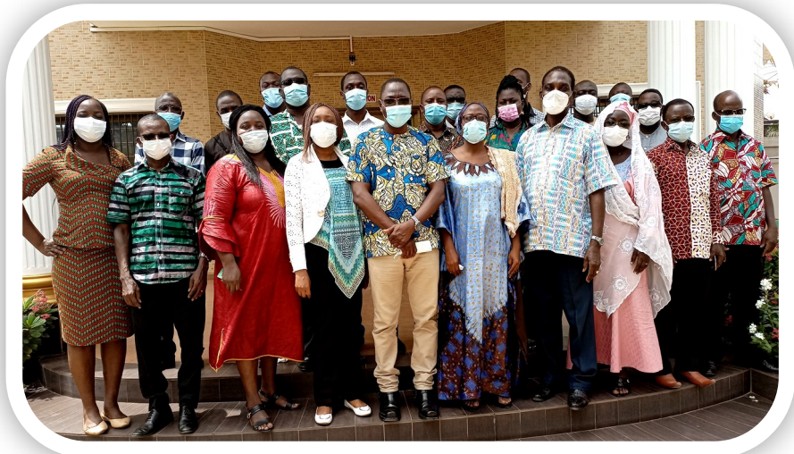
Photo de groupe de la formation

D'autres thématiques ont été également abordées. Il s'agit de la transition vers d'autres molécules, la gestion des échecs thérapeutiques, le suivi biologique et la charge virale, les troubles neurologiques et anxio-dépressifs, l'annonce du diagnostic, l'adolescence aux prises avec ses implications et les répercussions croisées avec le VIH, la gestion de l'inobservance et l'intérêt d'aborder la santé sexuelle de la reproduction. Les aspects de l'ingénierie pédagogique ont également été abordés afin d'outiller les futurs formateurs et coach de retour sur leurs sites respectifs à un transfert de compétences.