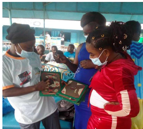
Grâce au soutien de Solidarité Sida, une animatrice échange avec les jeunes filles sur le port de condom féminin