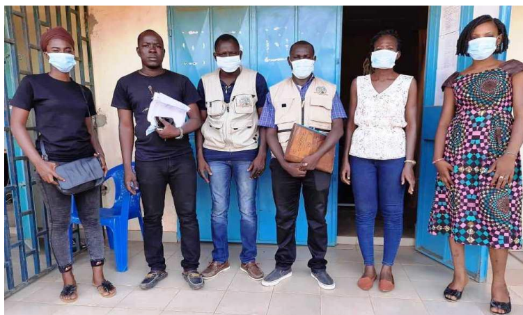
L'équipe de ALUBJ Burkina à la sortie d'une rencontre de bilan à Pouytenga.