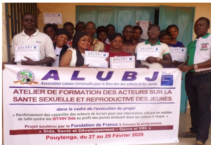
Avec l'appui de la Fondation de France, animatrices de ALUBJ, des TS et gérants de Sites ont reçu une formation sur la promotion de la SSR

Egalement, la Fondation de France a réaffirmé son engagement à soutenir les associations partenaires malgré cette crise et ALUBJ n'est pas restée en marge de cet élan de solidarité. En plus du financement accordé à l'association pour la mise en œuvre du projet « Projet de renforcement de capacités des acteurs de terrains pour une intervention efficace en matière de lutte contre les IST/VIH/SIDA au profit des jeunes évoluant dans les milieux à risque », elle a accordé à l'association un financement supplémentaire spécifique pour faire face aux imprévus engendrés par la crise sanitaire.