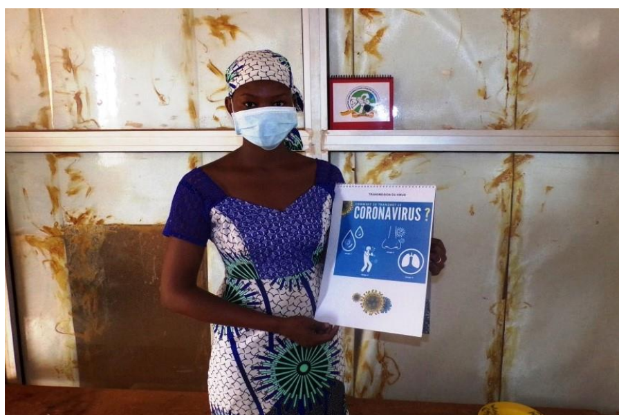
Une animatrice d'ALUBJ tenant une boîte à image confectionnée grâce aux outils mis à disposition par-de la Plateforme Elsa.

Pour permettre aux associations de mener à bien cette lutte contre le COVID-19, la Plateforme Elsa a mis à leur disposition des outils de communication afin de permettre aux associations de véhiculer des messages de qualité à l'endroit de leurs membres et bénéficiaires. En se référant à ces ressources et des