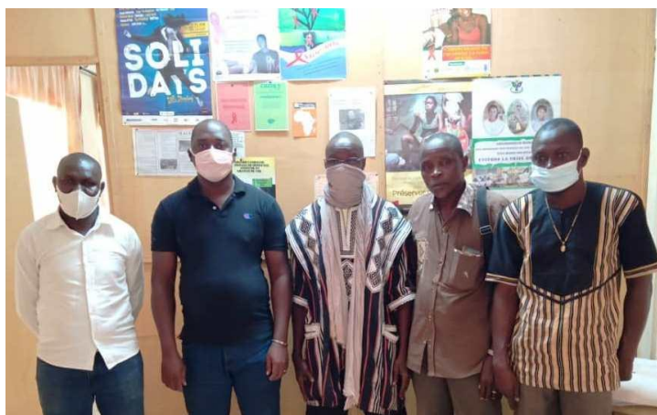
Visite d'une équipe de la CORAB/Centre à ALUBJ pour une formalisation du partenariat entre les deux structures

Au niveau de nos réseaux d'affiliation, des efforts sont faits pour renforcer les relations qui nous lient. Grâce à la bonne collaboration avec la CA/CMPJO, notre association bénéficie chaque année de kits de dépistage du VIH pour mener ses sorties de dépistage auprès des cibles considérées à haut risque. Aussi, avec le RENALDS et la CORAB/Centre, malgré les difficultés rencontrées par ces réseaux dans la mobilisation des ressources, nos structures se rencontrent périodiquement pour échanger sur les stratégies de mobilisation de ressources pour les associations. Enfin, avec la Mairie de l'arrondissement N°3 de Ouagadougou et le District Sanitaire de Sig-nonghin, nous organisons des interventions auprès des gérants ou agents de santé pour nous permettre de surmonter les éventuelles difficultés rencontrées à travers nos actions.