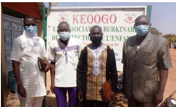
Sortie d'une visite d'échange entre les responsables de l'ALUBJ et de KEOOGO sur la collaboration pour la satisfaction des bénéficiaires

collaboration avec la BPVE. Une fois dans ces structures, nos bénéficiaires, avec qui nous restons en contact pour le suivi, nous expriment leur satisfaction à travers les prestations qui leur sont offertes. Par exemple, cinq (5) filles séropositives ont été référées cette année au sein de l'AAS et elles ont toutes été satisfaites des prestations qu'elles reçoivent. Aussi, huit (8) cas de VBG ont été référés vers KEOOGO grâce à une collaboration qui a permis de former une membre de ALUBJ comme femme leader chargée d'identifier les cas de violence et les référer vers KEOOGO.