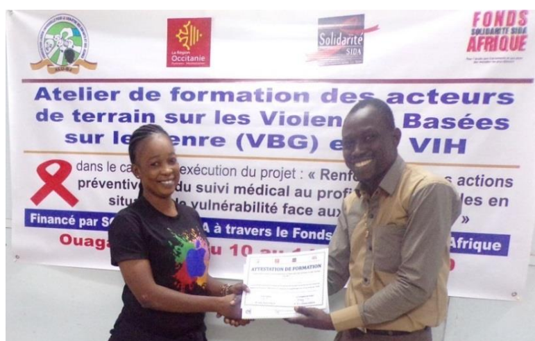
Grâce au soutien de Solidarité Sida, des filles de milieux à risques formées sur la prévention des VBG

Au niveau international, le partenariat avec l'Association Solidarité Sida se porte à merveille malgré les difficultés rencontrées à cause du COVID 19. Au cours de l'année 2020, Solidarité Sida a été flexible et a permis à ses partenaires dont ALUBJ de réaffecter une partie des financements octroyés dans le cadre de l'appel à projets international à la lutte contre le COVID 19. Cette flexibilité a permis de soutenir la réponse à l'épidémie de COVID 19 et de prendre en compte les réalités et difficultés engendrées par la crise sanitaire. Elle a aussi apporté à l'association un appui supplémentaire de 1000 masques chirurgicaux destinés à la protection des membres et des bénéficiaires.