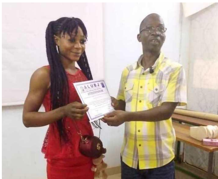
Formation des animateurs et animatrices sur la promotion de la santé sexuelle et reproduction des jeunes.

Le tableau ci-dessous indique l'ensemble des formations réalisées ainsi que les partenaires concerné.e.s par ces formations.