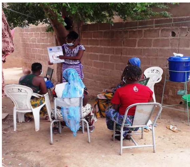
Une animatrice de ALUBJ /Kourittenga en séance d'animation sur le COVID 19 avec le soutien de la Fondation de France

Après les formations, les acteur.trice.s formé.e.s ont été responsabilisé.e.s pour mener des sorties d'animation de proximité par l'IEC/CCC. Les thèmes abordés ont porté sur les modes de prévention des IST/VIH/SIDA, les VBG, les conduites à tenir en cas d'infection d'IST ou du VIH, la prévention du COVID-19, la non-stigmatisation, l'importance du dépistage du VIH, le port du condom interne et externe, le suivi médical et bien d'autres thèmes en lien avec les comportements à adopter pour mieux vivre avec ou sans le sida. Les animations se sont déroulées dans les sites de travail et les domiciles des bénéficiaires.