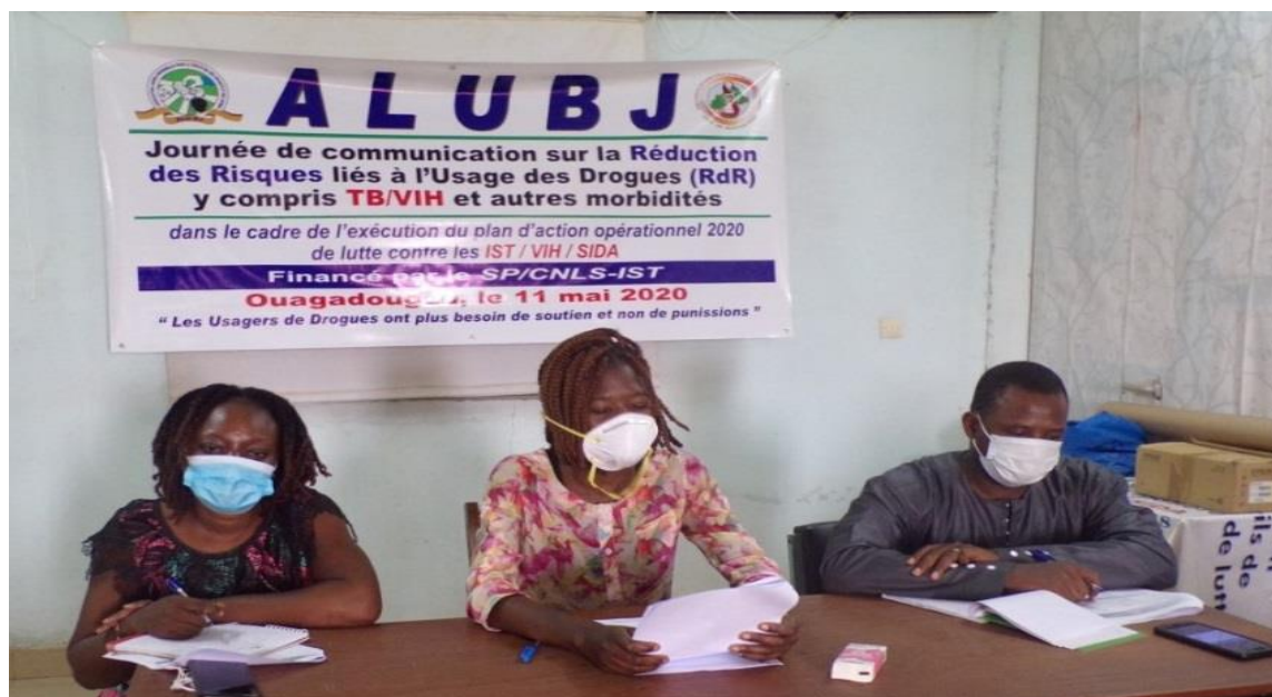
Organisation d'une journée de communication sur la RdR grâce à l'appui financier du SP/CNLS-IST et de l'accompagnement technique du SP/CNLD et de IPC/BF.

riposte contre le Sida. Egalement, le PAMAC a soutenu l'ALUBJ pour la réalisation du dépistage anonyme et volontaire du VIH des adolescent.e.s et jeunes.