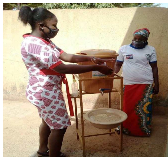
A gauche une bénéficiaire recevant des vivres et à droite un dispositif de lavage de mains installé au domicile des filles grâce à l'appui de Solidarité Sida.