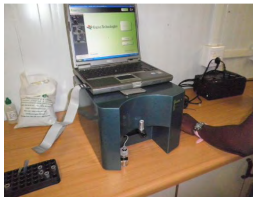
Le GUAVA (numération des CD4)