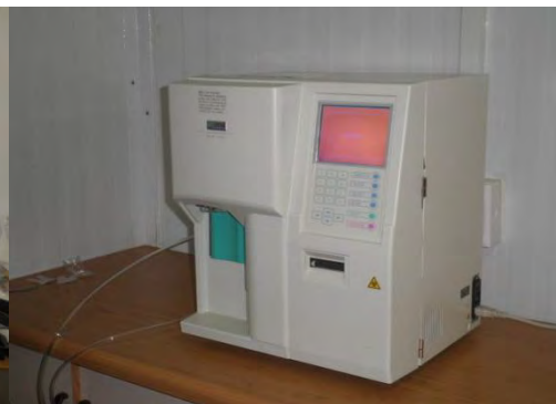
Le SYSMEX (Hématologie)