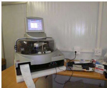
Le FULLY (Biochimie)