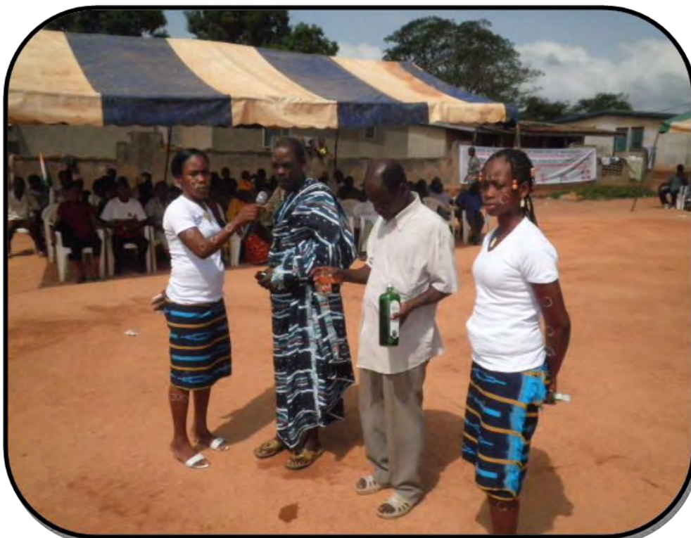
Libation du Chef du village de Zatta

Cérémonie de lancement du projet Malaria Round 8 Photos