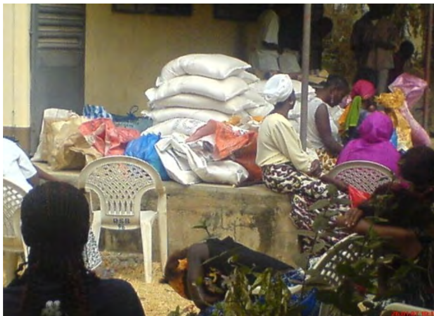
Un aperçu de la distribution des vivres fournis par le PAM