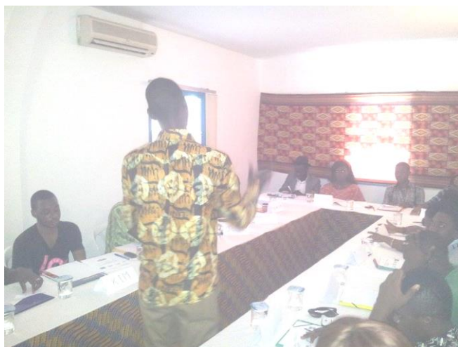
Les membres d'Alternative CI à la formation en soins et soutien