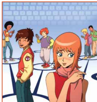
Illustrations : Alfonso Recio

ado, etc., permet d'accéder à des informations mais aussi de dialoguer avec des adultes en préservant son anonymat. Environ 44 % des adolescents recherchent des informations sur la sexualité sur Internet 2 sans toujours les compléter par un dialogue direct avec un adulte, professionnel ou non ;