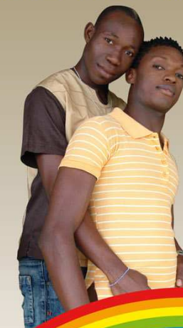
A l'intention des Hommes ayant des rapports sexuels avec les Hommes (HSH/MSM)

Ce dépliant s'adresse à tout homme qui a des rapports sexuels avec un ou plusieurs autres hommes, que ce soit par voie orale ou par voie anale.