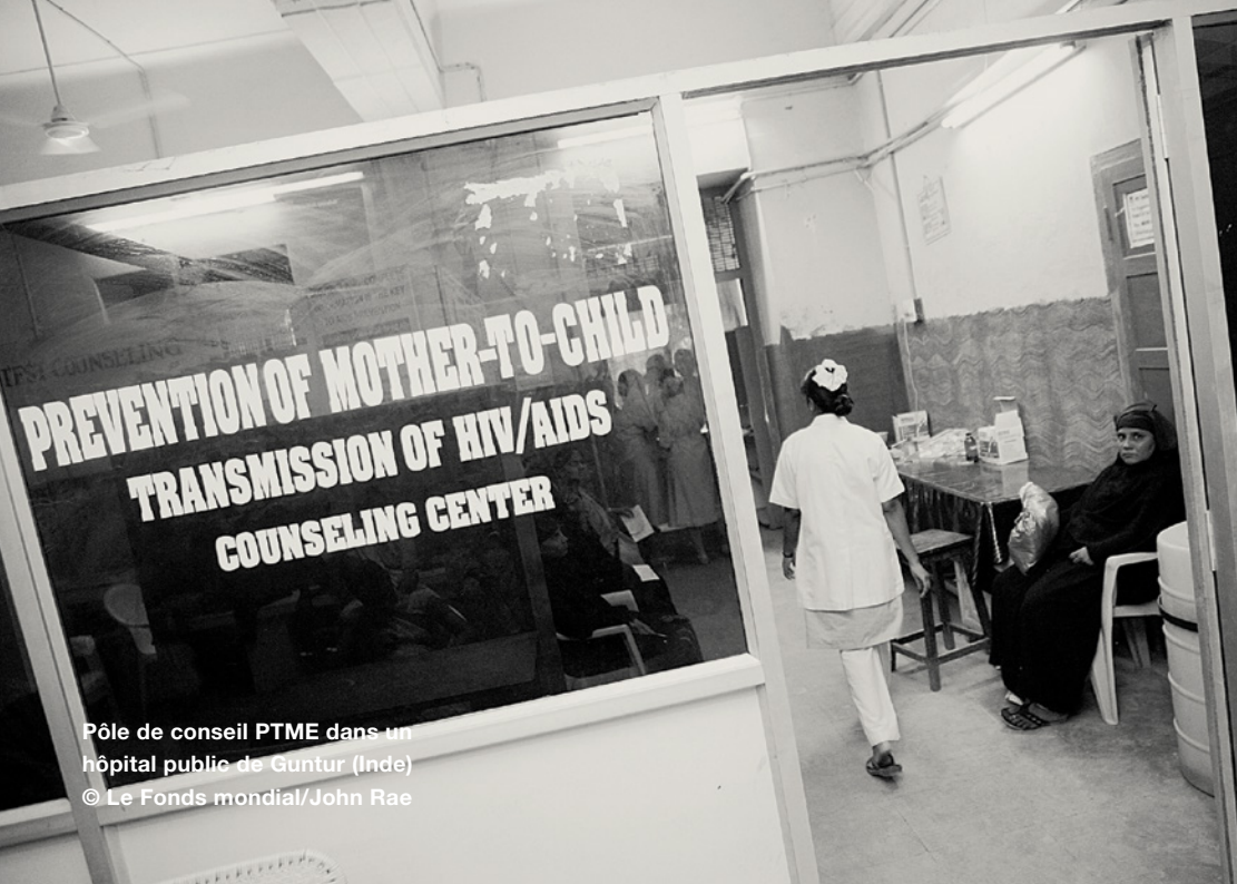
Pôle de conseil PTME dans un hôpital public de Guntur (Inde)