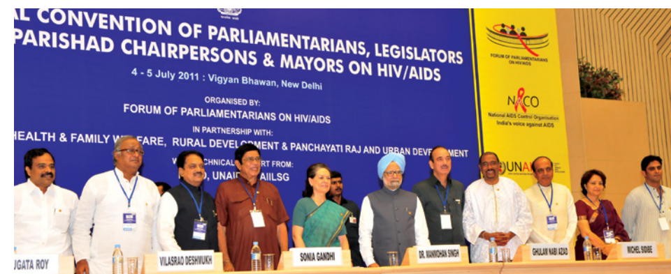
Participants à la Convention nationale des parlementaires, législateurs, présidents de Zila Parishad et maires sur le VIH/sida à New Delhi en juillet 2011, manifestation organisée par le Forum des parlementaires sur le VIH/sida (Inde). Le Président de la Commission nationale de planification a profité de cette réunion pour prendre l'engagement solennel de protéger le programme indien de lutte contre le VIH et le sida des effets de la crise financière mondiale en garantissant une aide financière nationale.

De nombreuses études ont mis l'accent sur le fait que les législatures nationales ont le potentiel voulu pour améliorer la riposte contre le VIH 5,6,7 . Toutefois la recherche suggère également que les parlements