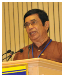
Oscar Fernandes

- Oscar Fernandes, parlementaire et Président du Forum des parlementaires sur le VIH/sida.