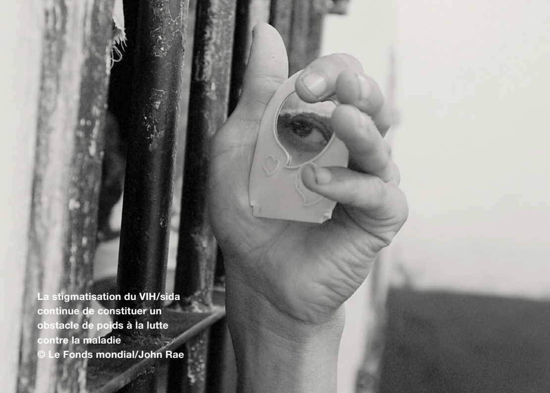
La stigmatisation du VIH/sida continue de constituer un obstacle de poids à la lutte contre la maladie