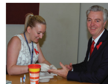
Simon Kirby

- Simon Kirby, député, Vice-Président de la Commission parlementaire sur le VIH/sida, Royaume-Uni.