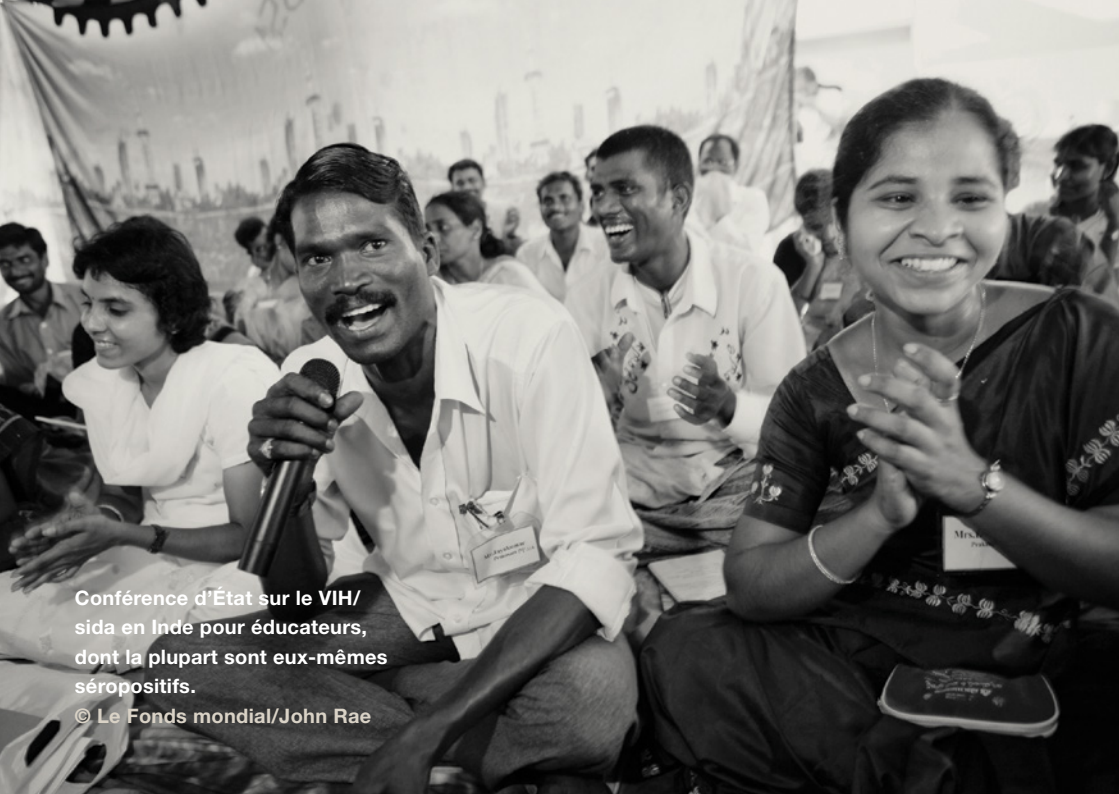
Conférence d'État sur le VIH/sida en Inde pour éducateurs, dont la plupart sont eux-mêmes séropositifs.

Un groupe informel de parlementaires peut être une bonne solution faute d'une commission officielle coûteuse. Les exemples du Royaume-Uni et de l'Inde montrent que des groupes informels peuvent être d'une grande efficacité. Les deux solutions ont leurs avantages et leurs inconvénients, mais toutes deux peuvent avoir un impact positif sur la politique de lutte contre le VIH.