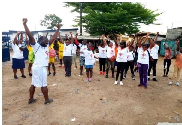
Figure 12: Exercices avant la marche sportive

La Journée mondiale de l'hygiène menstruelle au Cameroun a été célébrée le 28 Mai 2019 sous le thème « it's time action ». Cette journée a été commémorée dans toutes les antennes de Horizons Femmes à travers les activités telles que les causeries éducatives, la sensibilisation médiatique et la marche sportive.