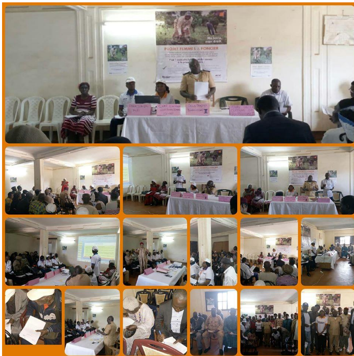
Figure 7 : Plaidoyer auprès des autorités administratives

Les principaux résultats auxquels l'on est parvenu au terme des activités menés sont présentés dans le tableau ci-après :