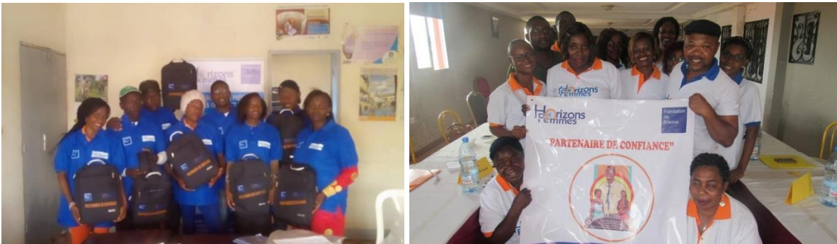
Figure 3: Atelier formation sur la SSR

Ce projet mis en œuvre avec l'appui financier de la Fondation de France, vise à combler le déficit de l'accès aux services SSR par les hommes et à impliquer davantage les hommes (Clients des TS et Partenaires des FVVIH) comme acteurs dans la promotion de la SSR. Ce projet débuté en avril 2019, était axé autour des activités de communication pour le changement de comportement, dépistages, appui psychosocial, juridique, médical, nutritionnel et achats de médicaments. Au cours de cette année, 2000 dépliants, 200 précis, 500 affiches, 200 polos, 200 Tee-shirts et 27 sacs ont été produits, 16 volontaires (dont 8 à Bafoussam et 8 à Yaoundé) formés sur la santé sexuelle et reproductive, de violences basées sur le genre et d'IST/VIH.