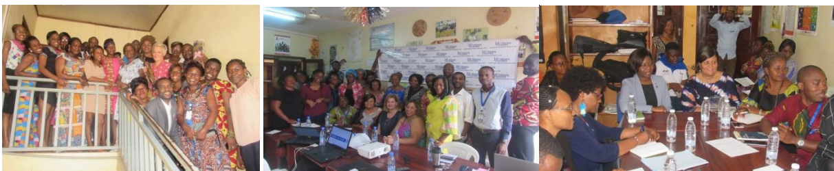
Figure 15: Visite Sidaction, février, USAID, mars et CDC, avril 2019