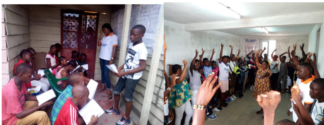
Figure 4: Activité de SSR e communauté et au DIC avec les adolescents

Ce projet est mis en œuvre depuis 2014 par Catholic Relief Services (CRS) en collaboration avec les OBC partenaires et notamment Horizons Femmes dans l'antenne du Littoral depuis 2018. Pour l'année 2019, ce projet s'est étendu dans l'antenne Ouest. Les interventions du projet sont axées sur 4 domaines : la santé, la sécurité, la stabilité et la scolarité tout en respectant les étapes de la gestion de cas.