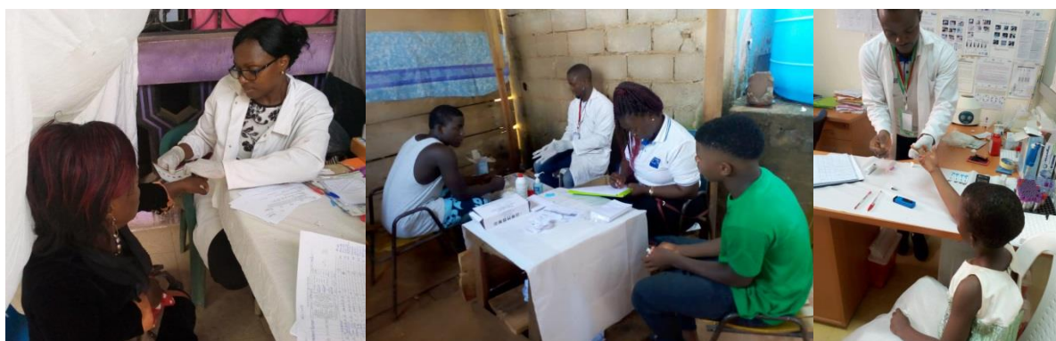
Figure 1: Dépistage dans les points chauds et enfant de TS

Mis en œuvre au Cameroun depuis 2015 par CARE International en collaboration avec les organisations à base communautaire (OBC) parmi lesquelles Horizons Femmes Yaoundé, Douala et Bafoussam (débuté en décembre 2019) avec l'appui financier de PEPFAR à travers USAID, le projet CHAMP vise à réduire les IST/VIH leur morbidité et mortalité associée, et atténuer l'impact du VIH sur le développement socio-économique du Cameroun, par le renforcement des capacités techniques du Gouvernement et de la société civile dans la mise en œuvre des activités de prévention, soins et traitement basée sur des preuves et la réduction de la stigmatisation envers les populations clés au Cameroun. Pour le début de la seconde phase, Horizons Femmes s'est vu attribuer une nouvelle zone d'intervention, celle de Bafoussam dans le district de santé de la Mifi. En 2019, les activités réalisées dans le cadre ce projet en direction des travailleuses de sexe, leurs clients ainsi que leurs enfants ont été: