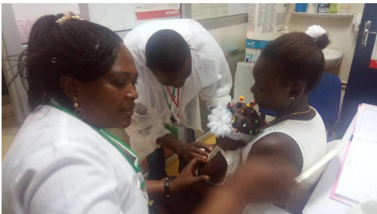
Figure 5 : Campagne de vaccination contre la rougeole et la rubéole