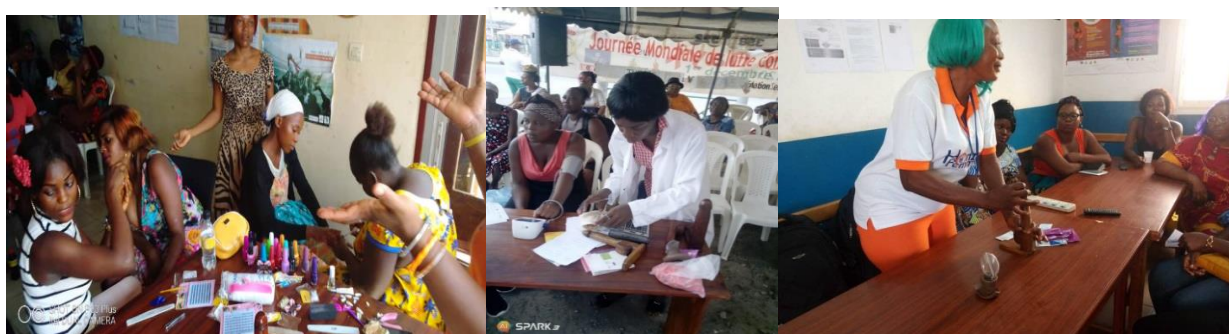
Figure 13: Quelques prestations au life center

La Journée mondiale de lutte contre le SIDA a été organisée ce 1er décembre 2019 sous le thème « Les Communautaires font la Différence ». A cette occasion, Horizons Femmes a marqué le coup par l'organisation des activités telles que la sensibilisation et dépistage VIH/Hépatites B/C et syphilis des travailleuses de sexe et leurs clients dans les points chauds et les Centres d'Ecoute « Life Center, l'éducation des adolescentes vulnérables sur la santé sexuelle et reproductive et la Parenté Positive, la campagne de sensibilisation en ligne sur le lien entre VIH, sexualité et adolescence et les activités récréatives et culturelle en direction de la cible.