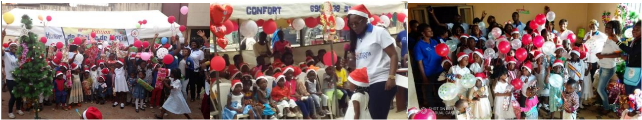
Figure 14: Arbre de Noël Yaoundé, Douala et Bafoussam

Le 23 Décembre 2019, le siège d'Horizons Femmes et ses antennes du Littoral et de l'Ouest ont vibré au rythme des mélodies de la fête de Noël. En effet la célébration de l'arbre de Noël est devenue une tradition au sein d'Horizons Femmes, et cette année nous n'avons pas dérogé à la règle. Il s'est agi d'un moment de partage et de convivialité entre les parents, les enfants et certains partenaires d'Horizons Femmes. A cet effet, nous avons noté la présence de 120 à Douala, 40 à Bafoussam et 123 à Yaoundé.