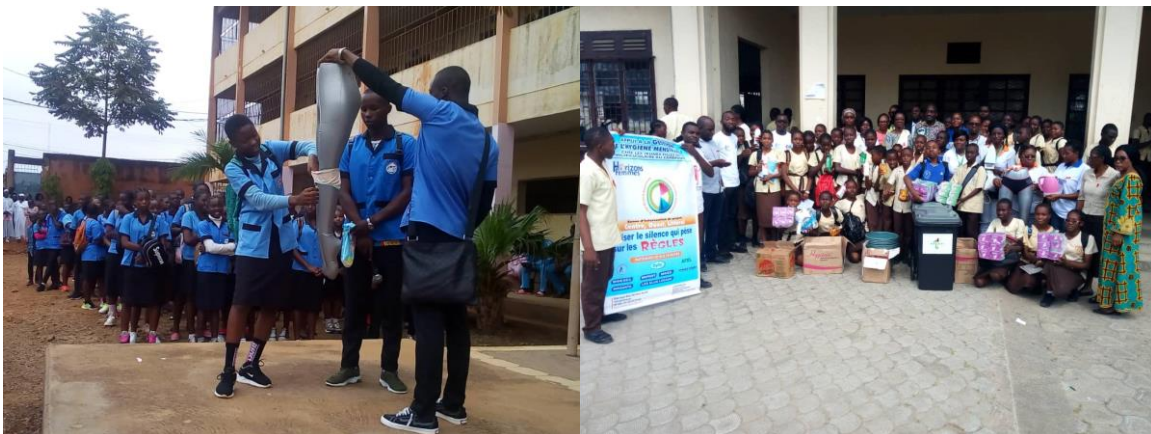
Figure 6 : Sensibilisation et Remise des dons au club GHM

Ce projet mis en œuvre au sein de l'association depuis 2016 a pour objectif d'améliorer la qualité de la gestion de l'hygiène menstruelle chez les jeunes scolaires. Au cours de l'année 2019. Les principales activités réalisées sont les suivantes :