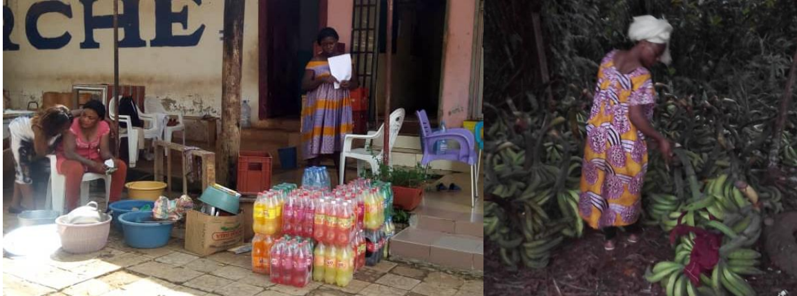
Figure 9: AGR restauration et vivres frais

Financé par la Mairie de Paris, le projet ARSPEC-VIH est mis en œuvre par CARE International en collaboration avec Horizons Femmes Yaoundé. Ce projet vise l'amélioration de la prise en charge holistique des patients afin de lutter contre leur vulnérabilité notamment par l'autonomisation nutritionnelle et économique et de favoriser ainsi une inscription durable dans le parcours de traitement ARV en vue d'une charge virale indétectable. Pour ce faire, le projet est centré sur l'accompagnement global des PVVIH pour favoriser leur autonomisation nutritionnelle et économique. Dans l'atteinte de cet objectif, deux grands axes ont été définis ; D'une part, la mise en place et promotion de l'approche Association d'Épargne et Crédit (AVEC) et des Activités Génératrices de Revenus (AGR) auprès des groupes de soutien d'aide à l'observance thérapeutiques des PVVIH/SIDA; D'autre part l'appui aux groupes d'aide à l'observance et au soutien économique y compris la sensibilisation sur la nutrition, et les domaines connexes (santé reproductive (SR), planification familiale (PF), violences basées sur le genre (VBG), infections sexuellement transmissibles (IST)).