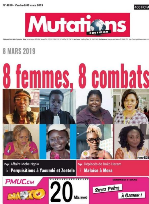
Cf : Quotidien Mutations, Edition N°4810 du 08 mars 2019

La capacité de la Présidente à influencer positivement les autres maillons de la société dans le but de les conduire vers l'objectif de l'émancipation et du bien-être de la femme est ainsi reconnue et magnifiée de source indépendante. Ce qui constitue également un témoignage manifeste sur le rôle avant-gardiste qu'elle a su incarner, et qui lui a permis d'impulser l'Association parmi les OBC qui comptent le plus sur les questions de la femme au Cameroun.