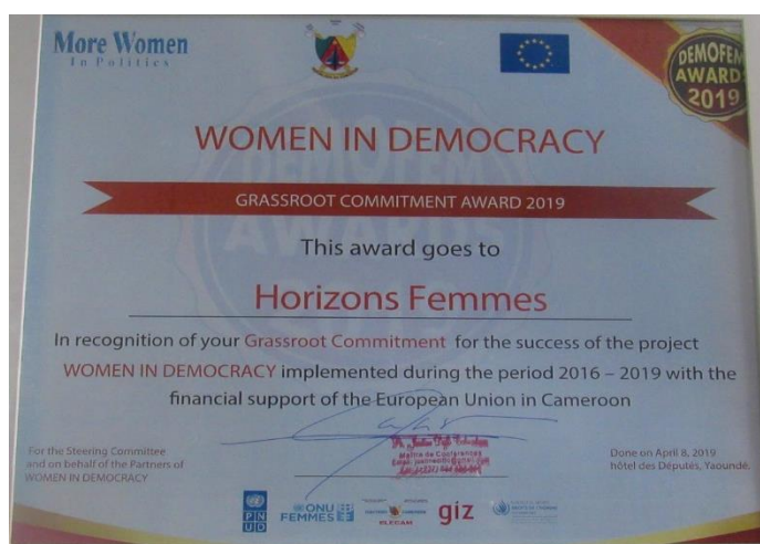
Figure 16 : Prix décerné à Horizons Femmes par le projet DEMOFEM

Le projet DEMOFEM monté sur le modèle du Projet «Elections au Féminin » conduit par Horizons Femmes (2013-2015) et également financé par l'Union Européenne, est une initiative multi-acteurs, qui a connu la contribution de notre association depuis la conception et pour la mise en œuvre.