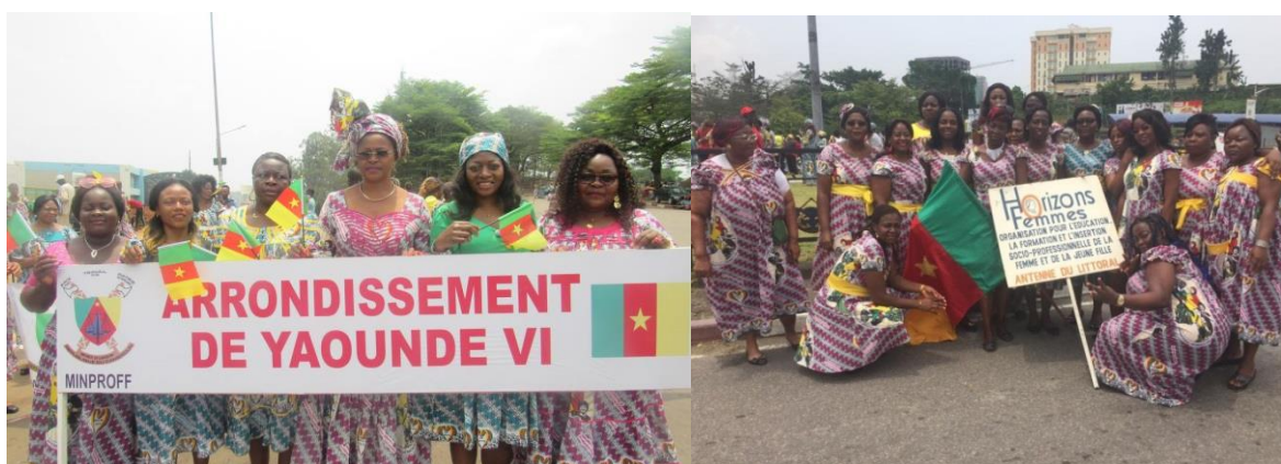
Figure 10: A la place du défilé le 8 mars

« Croisade contre les Inégalités de sexe : s'arrimer à la nouvelle impulsion » a été le thème de la 34 ème édition de la journée Internationale de la femme. Plusieurs activités ont marqué cette festivité. Nous avons eu droit aux activités sportives (une marche sportive,