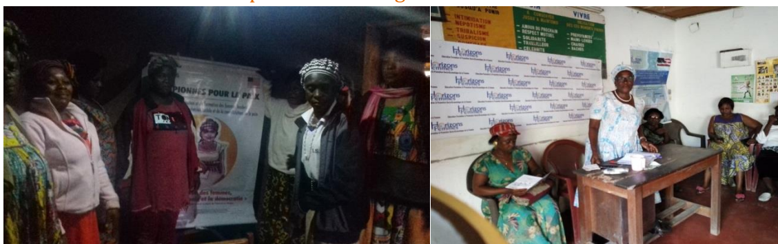
Figure 8 : Causeries éducatives sur le rôle de la femme dans la consolidation de la paix et la cohésion sociale

Le projet « Championnes pour la paix » qui bénéficie du soutien de l'Ambassade des Etats Unis au Cameroun a débuté en octobre 2018 et s'est achevé en mars 2019. Il a pour objectif de contribuer à la promotion de la démocratie, des droits de l'Homme et à la consolidation de la paix grâce à la dissémination des messages de paix et du procédé d'observation électorale auprès des femmes dans les associations des régions du Littoral et de l'Ouest. Les activités réalisées durant la période de janvier à mars 2019 étaient essentiellement axées sur les causeries éducatives en lien avec les thématiques telles que les droits de l'Homme, le rôle de la femme dans la consolidation de la paix et la cohésion sociale, le rôle des femmes dans la prévention et la gestion des conflits en période électorale. Les résultats suivant ont été obtenus :